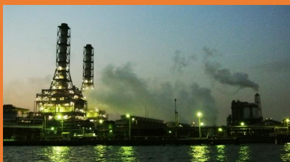
いま大人気の工場夜景ツアー