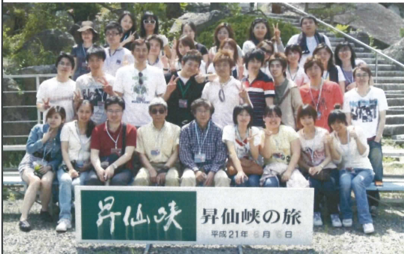
2009横浜商科大学留学生会課外活動集合写真

[第11号] 横浜商科大学留学生会発行 〒230-8577 横浜市鶴見区東寺尾4丁目11番1号 編集者 陳 吉龍