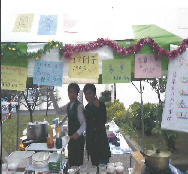
留学生会模擬店 看板ムスコ達