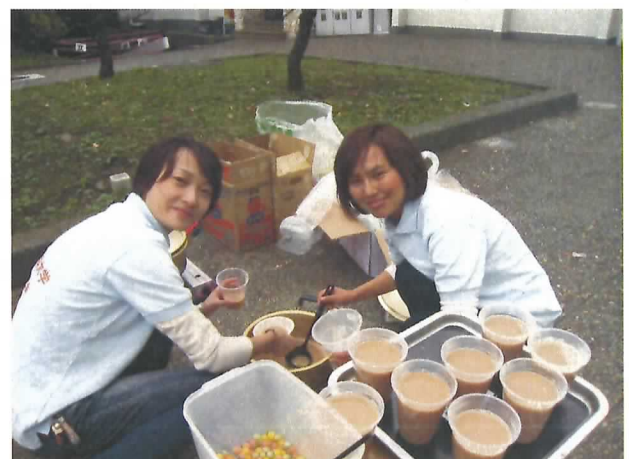
タピオカ・ミルクティーを作っています〜す(^_^)