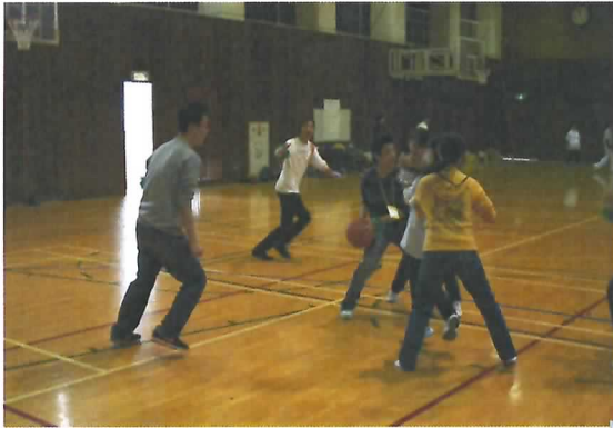
笑いっぱい、汗びっしょり、楽しいスポーツ大会でした。

今年、17名の新しいメンバーを迎え、先輩とのコミュニケーションを深めながら、楽しい大学生活を送ってもらうため、横浜商科大学の開校記念日である4月18日(金)に学校の体育館で新入生歓迎会を実施しました。